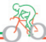
TABELLA DI MARCIA 68ª COPPA MONTES